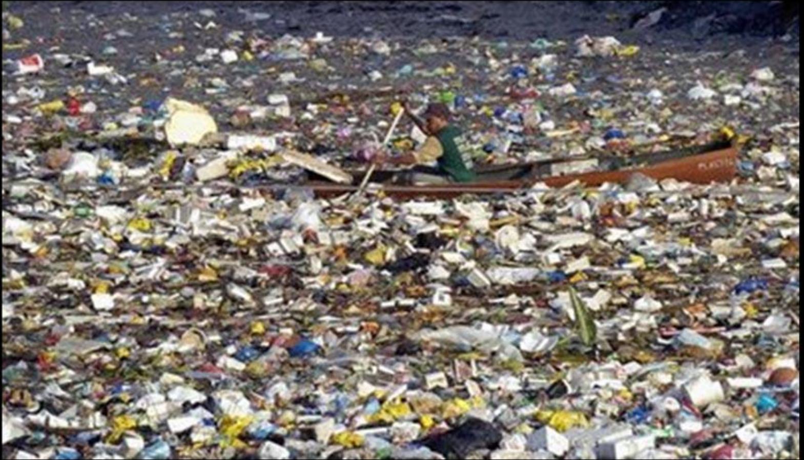
Photo of Pacific Ocean Year 2004